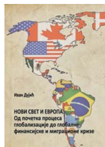
Ivan Dujčić, Novi svet i Evropa: od početka procesa globalizacije do globalne finansijske i migracione krize, 2017.