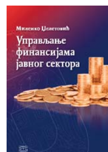
Milenko Dželetović, Upravljanje finansijama javnog sektora, 2016.