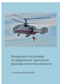
Aleksandar Jazić, Vanredne situacije i savremeni trendovi razvoja sistema zaštita, 2017.