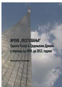
Vladimir Trapara, Vreme „resetovanja“: Odnosi Rusije i Sjedinjenih Država u periodu od 2009. do 2012. godine, 2017.